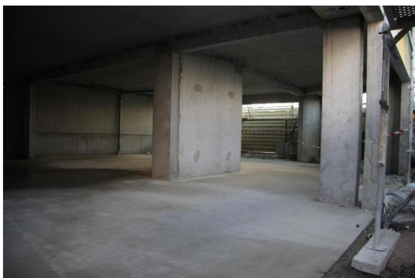
Aux pieds du Caducée, deux magasins : une chaîne de vêtements et un commerce challandais déjà existant qui déménage en centre-ville.