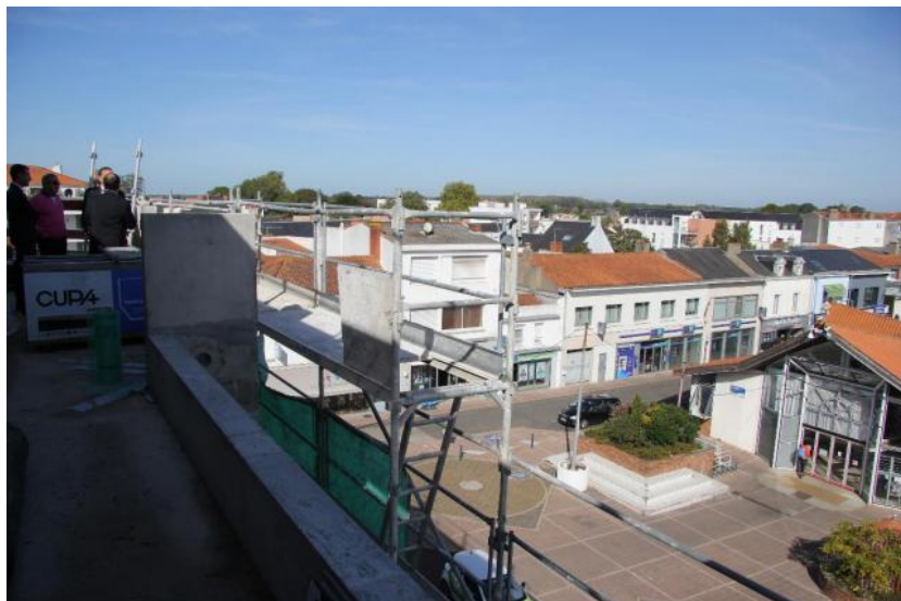
Le dernier étage du Caducée surplombe les Halles de Challans.